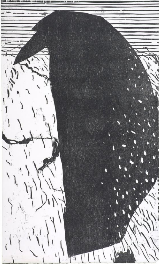
(Chiquet Mawet, Migraine, mi-raisin, Alternative libertaire 1999)

“ Michel Barzin s’inspire du quotidien contemporain (e.a. le sport) qu’il décrit souvent avec ironie, en un langage graphique inventif. Bousculant la cohérence visuelle classique, ses compositions s’enrichissent des syncopes de l’image, de la confrontation de sujets hétérogènes, et tirent leur expressivité d’une juxtaposition de signes formels nerveusement inscrits selon les procédures de type abstrait. Abordant volontiers de grands formats et rompu aux secrets de toutes les techniques de l’estampe, l’artiste mélange souvent les procédés d’exécution. Il conjugue volontiers poésie et subversion, produisant des images narquoises, parfois grinçantes, grâce aux associations d’objets ou de personnages qu’il dessine ou grave. ”